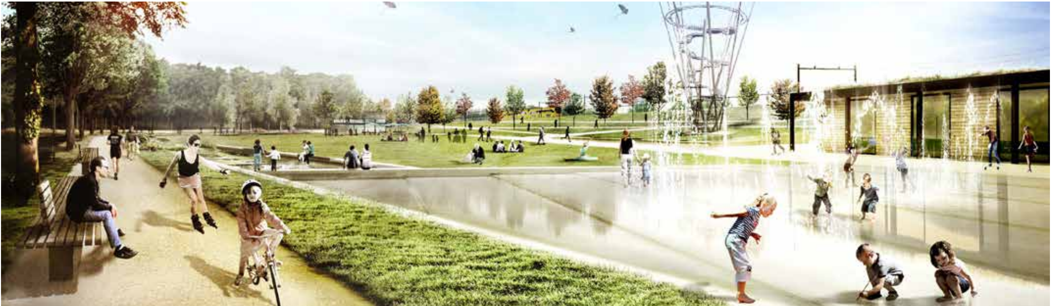
impressie definitief ontwerp