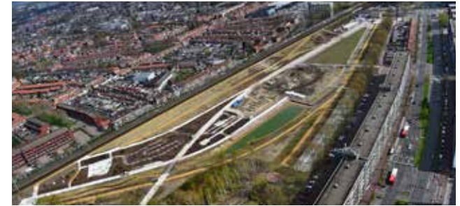
Spoorpark vanuit de lucht - foto Marcel van den Bergh (lage resolutiefoto, op dit moment nog niet rechtenvrij)

De noordzijde met het spoortalud ligt volop in de zon. In het ontwerp is hierop ingespeeld door de geluidswal onderdeel te maken van het park. Het steile 1:1 talud met een lengte van 600 mtr is verflauwd tot taluds met een gemiddelde helling van 1: 6. Er zijn paden aangelegd op het hoogste niveau op 6 meter boven maaiveld en op een tussenniveau. Het talud biedt uitzicht over park en stad. Hier ervaar je lucht en ruimte en heb je zicht op de skyline van de stad.