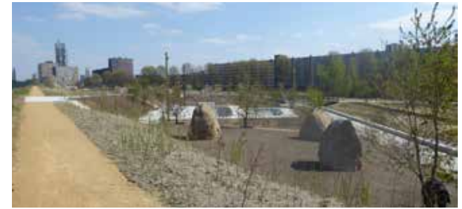
zicht vanaf talud over urban sports zone

In het waterlein worden lucht, park en stad weerspiegeld. Kleine spuiters of 'waterogen' vullen het waterplein. Het water wordt teruggepompt en gezuiverd, zodat het voldoet aan de hoogste speelwaterkwaliteitseisen. In de beek loopt het water langzaam kabbelend over een zandbed met keien naar het helofytenfilter, waar het wordt teruggepompt. De bronpoel, de wadi en de vijver vormen samen een regenwaterbergingsysteem voor regenwater uit een aangrenzende buurt. Bij het hoogste niveau infiltreert het water via 'lekke randen' van de vijver weer in de bodem.