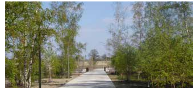
boulevard door berkenbosje