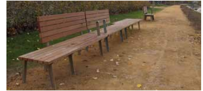
vanaf het zitmeubilair langs de laan is het park te overzien