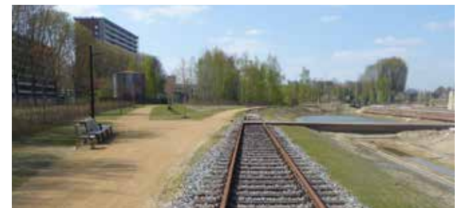
spoorpad langs vijver