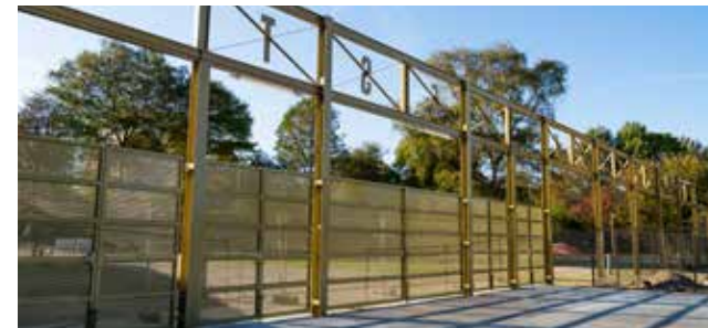
entree pergola west

'DE BEELDTAAL GEEFT SAMENHANG AAN GEBOUWEN EN INRICHTINGS- ELEMENTEN'