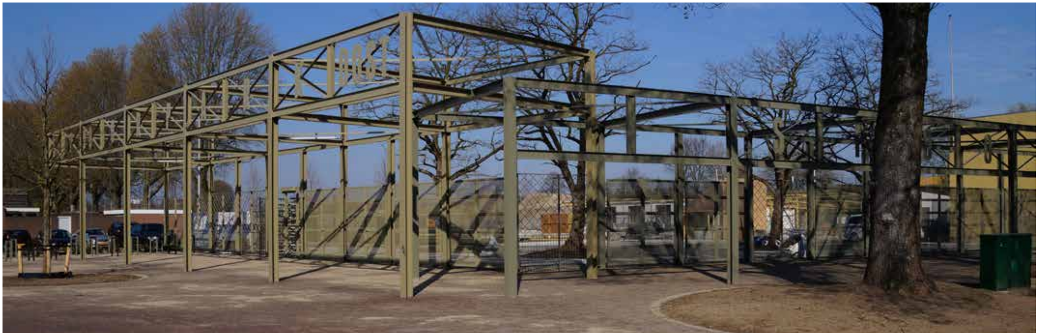
de pergola aan de oostzijde vormt samen met de bomen een royale entree