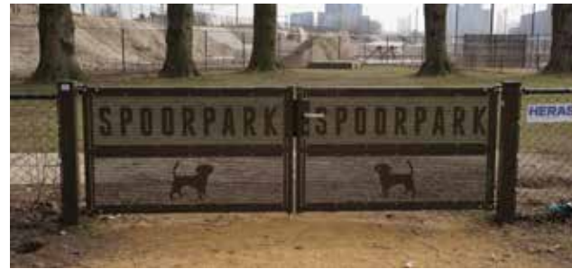
in de geperforeerde poorten zijn tekst en beeld opgenomen

verzoek van oudere parkbezoekers nodigen leuning van bruggen en banken uit tot het doen van gymoefeningen. En om het park ook in de avond goed te benutten kan een deel van de verlichting door bezoekers zelf worden geregeld. Aan pergola's en lichtmasten mogen tijdelijke bewegwijzering en versieringen worden gehangen. Zo worden het echte gebruiksobjecten.