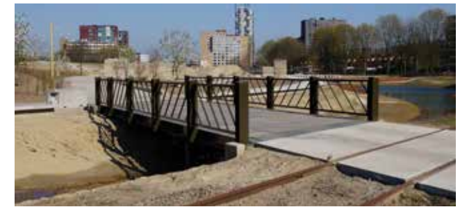
stoere bruggen refereren aan de spoorse historie