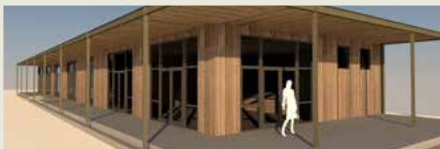
Scoutinggebouw Esjeeka met kiosk, parkpaviljoen T-huis, paviljoen BeweegR