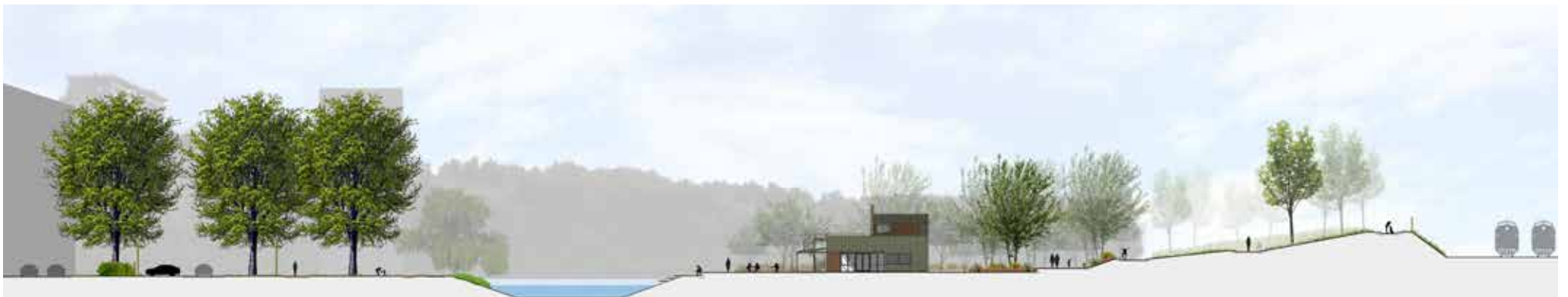
doorsnede park ter hoogte van het T-huis